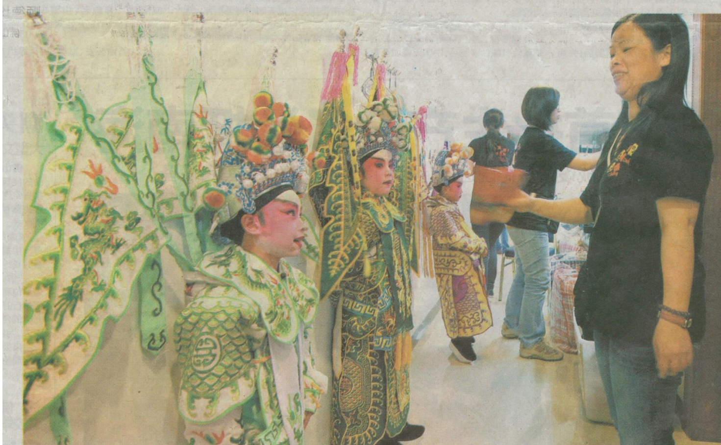
前日,来自佛山和香港两地的少年儿童在佛山市红星影剧院联星影城进行粤剧展演。化妆间内,老师为等候出场的小演员“降温”。