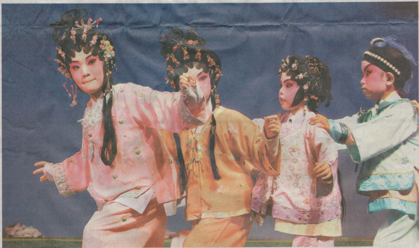
香港“查笃撑”儿童粤剧协会的小演员表演粤剧《月亮姐姐睡何乡》之《反斗睡房》。/ 佛山日报记者甘建华 摄

佛山日报讯 记者杨丽东、吴英姿报道：“阿妈那个年代的”粤剧，由4岁~12岁的小朋友来表演，会是什么场面？昨日，佛山、香港、广州、深圳四地“儿童粤剧创作与粤剧市场保育发展研讨会”在佛山举行。