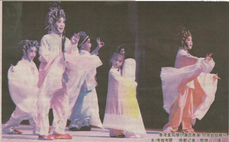
香港查笃撑小演员表演《月亮姐姐睡何乡》,有板有眼。

4月10日-13日,香港查笃撑儿童粤剧(下称“查笃撑”)创作展演在佛山举行,连演三天,每场爆笑。查笃撑已连续办二十年,佛山曾办过娃娃粤剧团,仅维持一年。查笃撑的发展模式或许能对佛山娃娃粤剧团的生存提供一些借鉴。